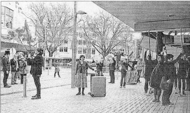
Una performance llevada a cabo en Nueva Zelanda en la que se oculta la publicidad que hay por la calle.

El tema central de la Bienal de Estambul esta vez será analizar el espacio público como foro político. También servirá para crear ideas y formas sobre otros temas como la civilización y lo salvaje, la democracia o el papel del arte contemporáneo en nuestra sociedad.